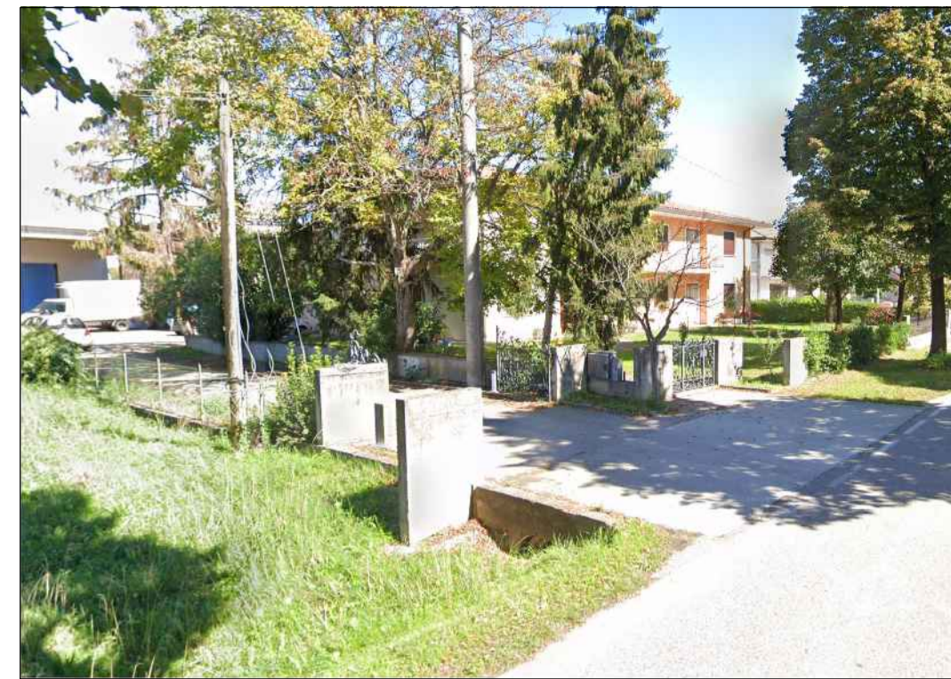
FOTO 1 - INIZIO PISTA CICLABILE_SP.117, civ. 81