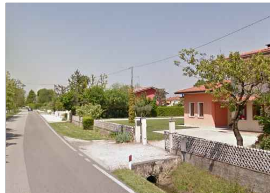
FOTO 2 - FINE PISTA CICLABILE_SP.117, civ. 111